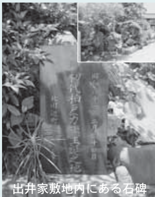
出井家敷地内にある石碑

寛政8(1796)年、59歳にて没。生家出井家に伝わる位牌には 真台院高岳智教居士 伊勢ノ海 寛政八年八辰 五月二十日 村右衛門 とあります。